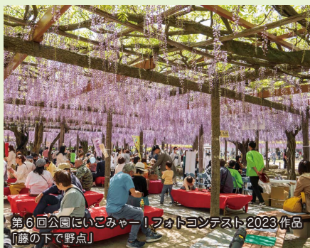
第6回公園にいこみゃー!フォトコンテスト2023作品 「藤の下で野点」