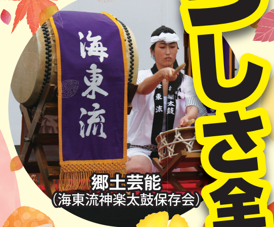
郷土芸能 (海東流神楽太鼓保存会)