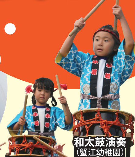
和太鼓演奏 (蟹江幼稚園)