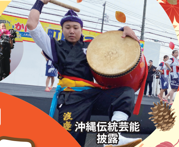
渡慶 沖縄伝統芸能披露