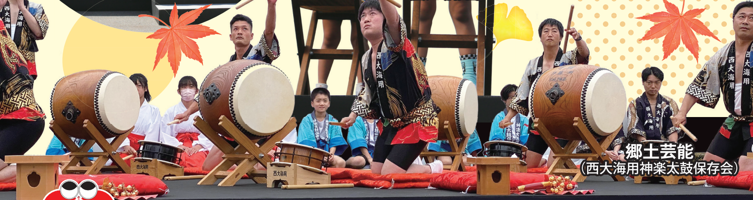
郷土芸能 (西大海用神楽太鼓保存会)